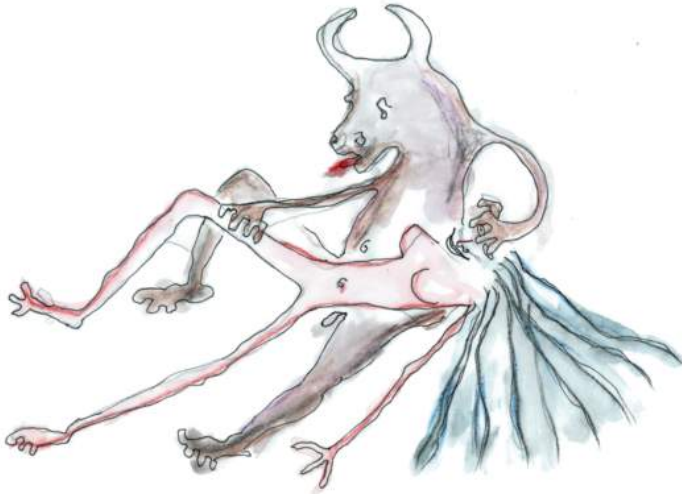
Je suis le bœuf et le boucher , dessin de travail.

Non vraiment, Carmen n'est pas une histoire d'amour, c'est l'histoire du courage, des courages... Pas l'histoire de nos moments de gloire, non, le contraire : l'histoire d'une défaite, de nos défaites, quand on a la force, l'élégance, le panache de perdre en beauté.