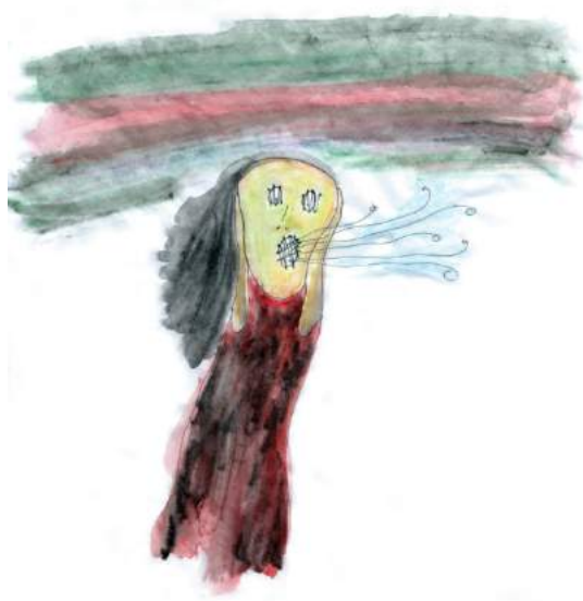
Carmunch, dessin de travail.