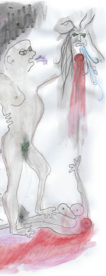
Laisse-moi te sauver ! dessin de travail